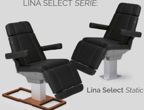
Lina Select Wood

ENTDECKEN SIE AUCH DIE ANDEREN TOP-MODELLE DER LINA SELECT SERIE: