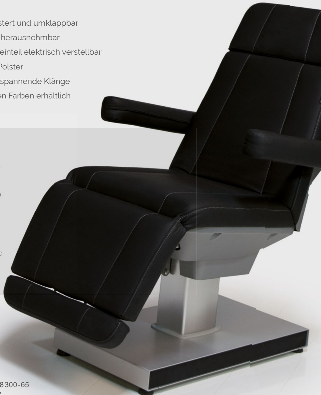
Lina Select Static