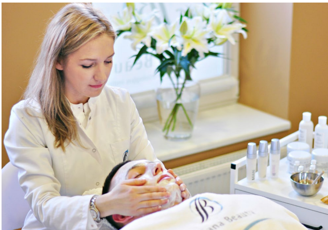
Die richtige Reinigung und Pflege der Männerhaut ist das A und O einer gelungenen Behandlung.

WAS MÄNNER WOLLEN – Dass ein Mann nur Wasser, Deo und Aftershave braucht, ist schon längst nicht mehr so. Auch Männer wünschen sich eine schöne, gepflegte und gesunde Haut und das Angebot an Produkten ist in den letzten Jahren stark angestiegen.