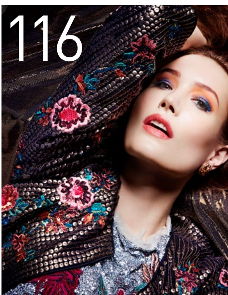
POWERLOOKS | Neue Trends 2017/18