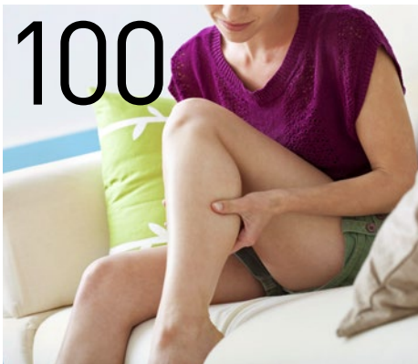
SCHWERE BEINE | Frühes Warnsignal!